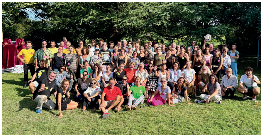
La belle équipe des artistes et bénévoles entourant les trois Zyvettes.

accessoires insolites. Les visiteurs ont pu, par exemple, admirer une «voiture de luxe» construite avec des matériaux de récupération, qui a nécessité 6 mois de travail ou encore des incrustations d'œils dans un cèdre majestueux créées pour l'occasion.