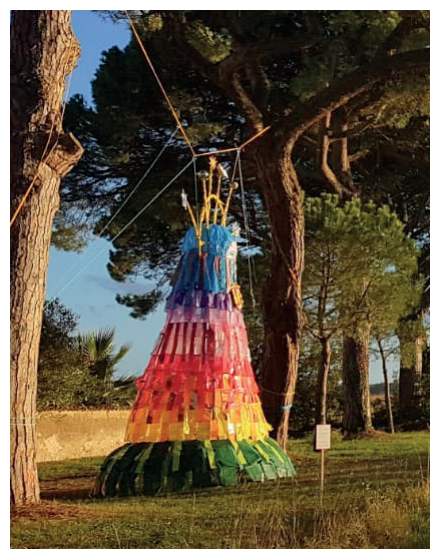
Installation de Claire Noëlle Mouy sous les grand pins parasols du parc de Nicouleau.

Le programme de cette édition était, en effet, soutenu avec des animations toutes les demi-heures. Une troupe a ainsi créé des parades chantées, une jeune danseuse a donné son interprétation du précieux-ridicule, ou une performance autour d'une course de larmes à l'aide d'oignons ont marqué les esprits. Des souvenirs incroyables pour tous. Beaucoup de sourires devant des œuvres un peu loufoques, de la surprise autour de performances insolites, dansées, racontées, ou