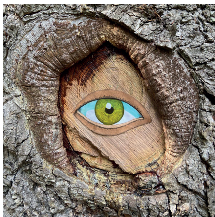
Installation de Pierre Pavloff

L'équipe des bénévoles a été étoffée cette année par de nouvelles recrues et ont permis d'accueillir les visiteurs, de les restaurer avec des repas confectionnés par leurs soins. Ils ont aussi été au plus près des artistes pour les aider à installer les œuvres dans les espaces naturels en organisant des espaces cachés dans le maïs (merci aux agriculteurs), en transportant des œuvres imposantes ou en trouvant des