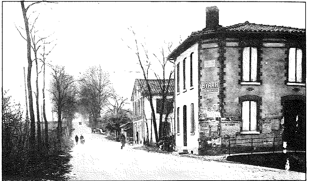
Dans les années 30...

L'église située hors du village est très petite et n'offre aucun intérêt, elle doit être reconstruite. (tout est dit pour justifier