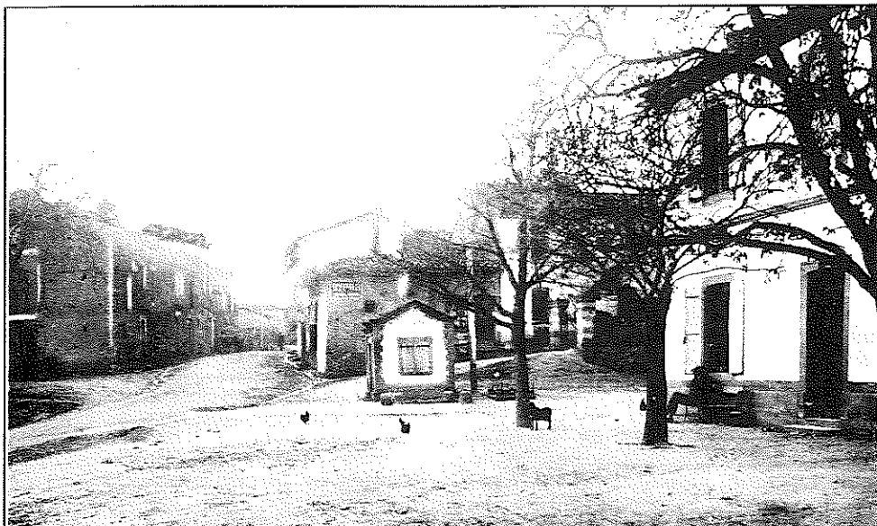
Le calme de la Place